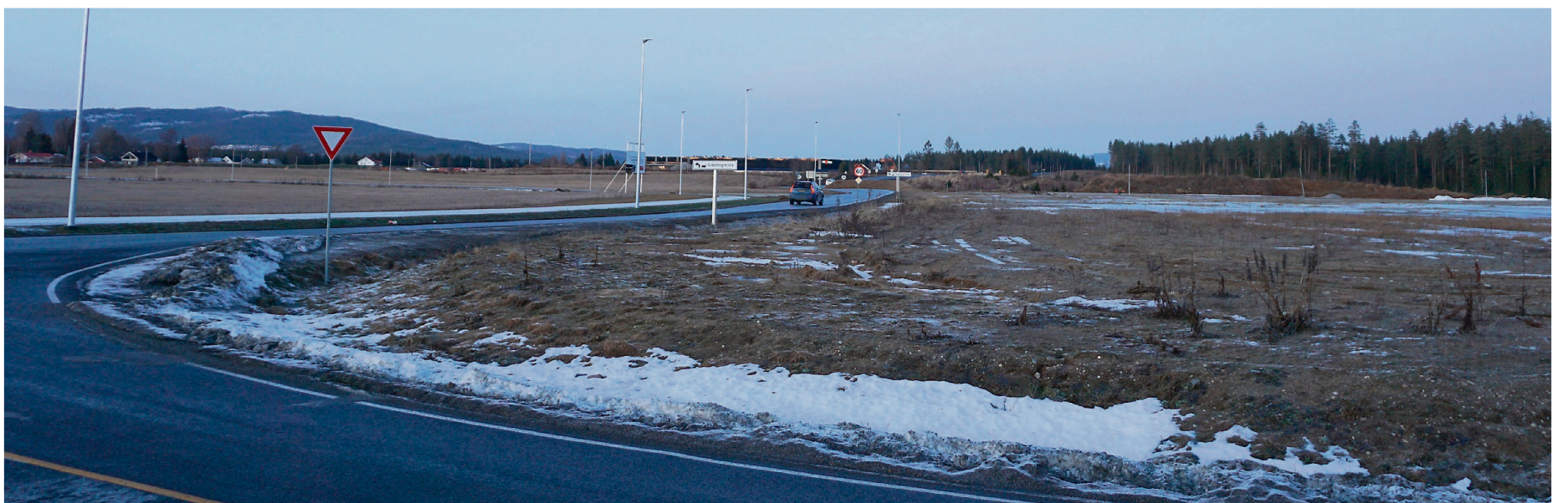
NÆRINGSPARKEN: Grunneierne har gått sammen og bygd infrastruktur, og flere selskap er på vei inn i næringsparken.