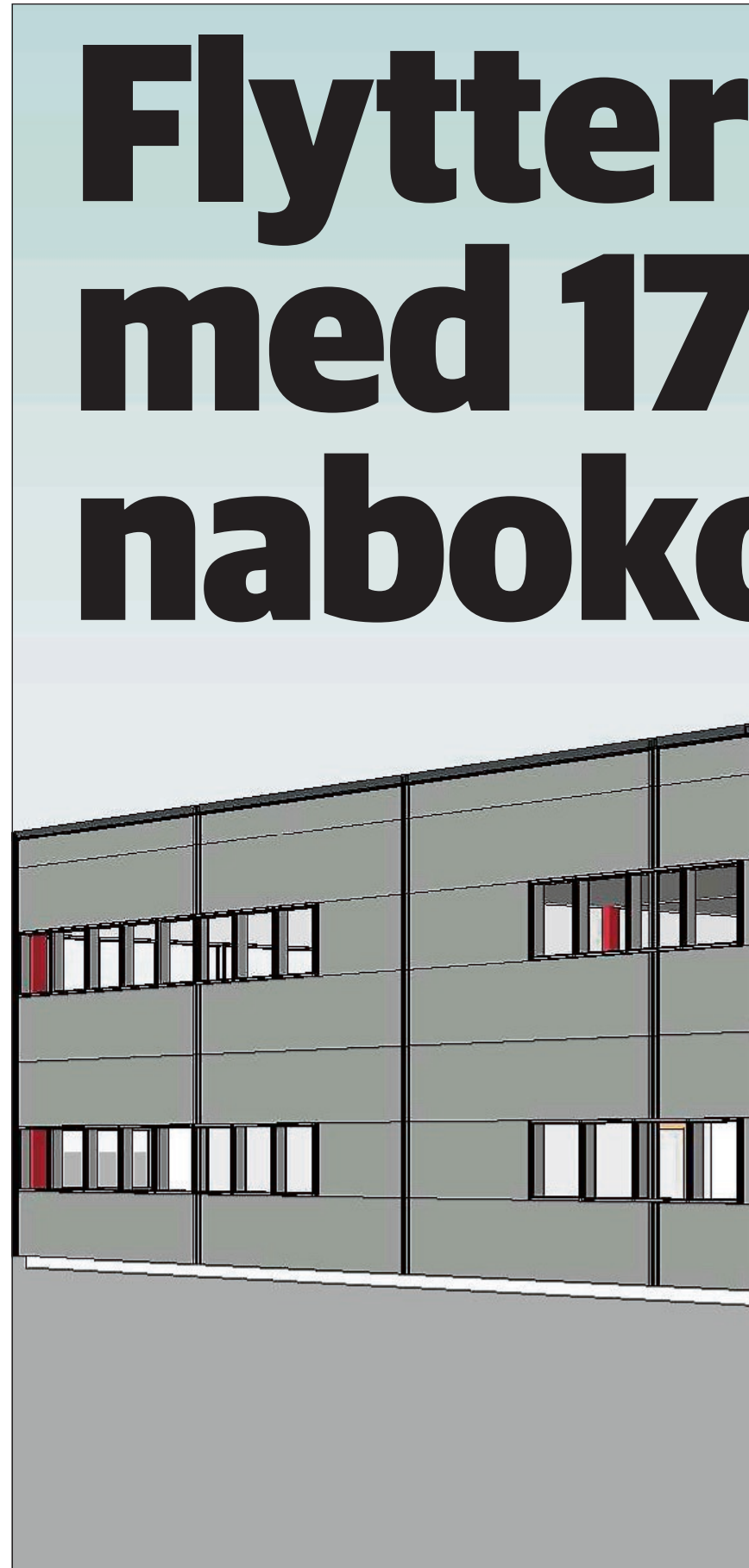
NYBYGGET: Skisse av Sisu Produkters kommende nybygg i Nannestad.